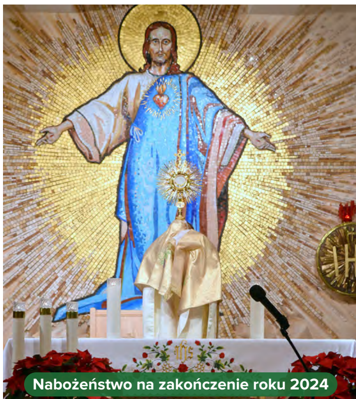
Nabożeństwo na zakończenie roku 2024