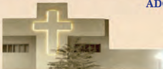
Jezuicki Ośrodek Milenijny

Spowiedź w 1. piątek miesiąca - 7:30-8:30; 17:30-19:30